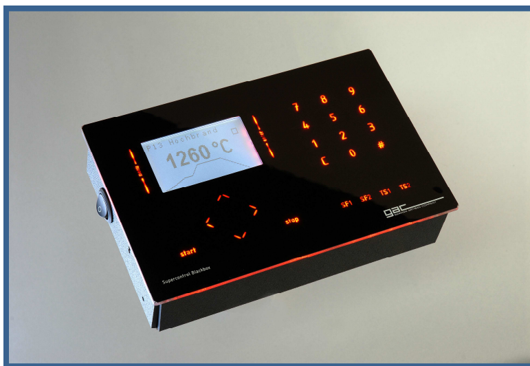
Blackbox 2009 mit Sensortastenfeld